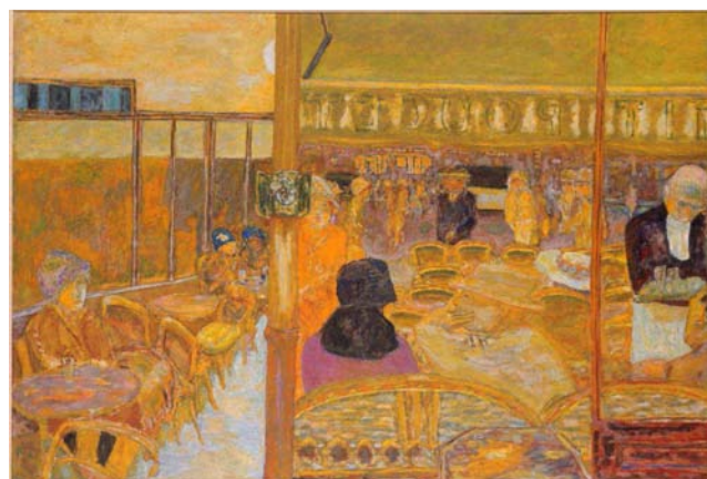
Pierre Bonnard Le café du Petit Poucet, 1928 Huile sur toile Musée des Beaux-Arts et d'Archéologie, Besançon