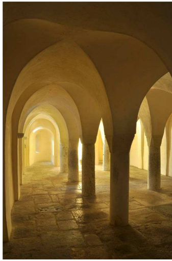
Crypte de l'église Saint-Désiré de Lons-le-Saunier