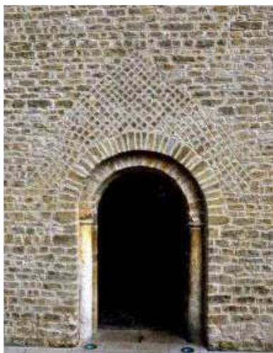
Saint-Lupicin, portail occidental de l'église et appareil réticulé