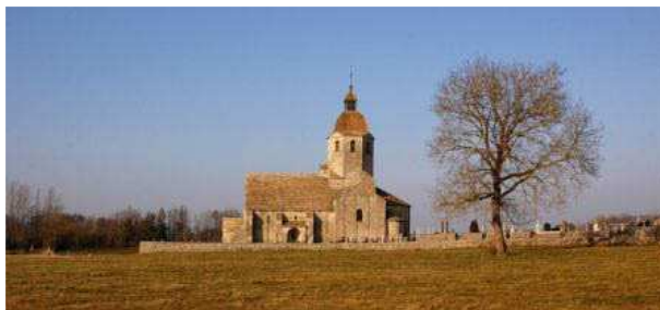
Saint-Hymetière, église, vue générale depuis le sud