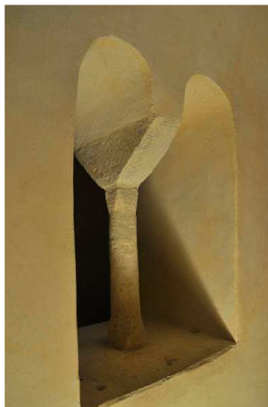
Détail de la baie géminée de la crypte de Saint-Désiré